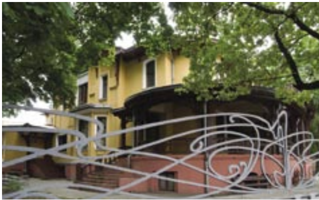
Vila Nosova na ul. Věděnské, rok 1903, arch. L. N. Kekušev Особняк Носова на Введенской пл., 1903 г., арх. Л. Н. Кекушев Mansion of Nosov in Vvedenskay Square, 1903, arch. L. N. Kekushev