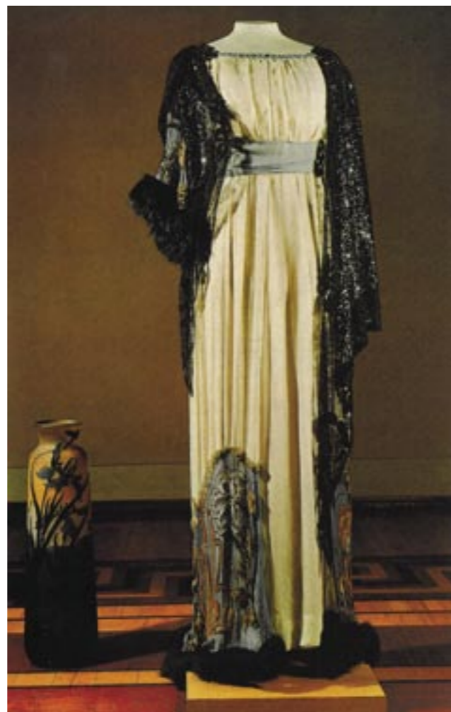
Večerní róba, rok 1910, Petrohrad, ateliér A. G. Gindus Платье вечернее. 1910 г., Петербург, Мастерская А. Г. Гиндус Evening dress. 1910, St. Petersburg, Studio of A. G. Gindus

V průběhu svého pobytu v Paříži se Lamanová seznámila s Paulem Poiretem. Významný francouzský mód-