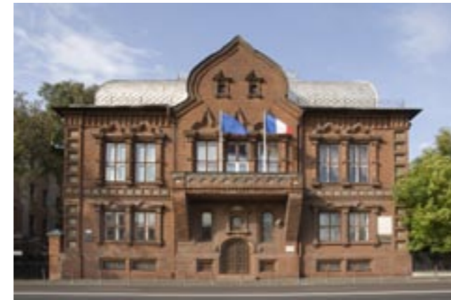
Budova Cvětkovské galerie, rok 1899—1901, arch. V. M. Vasněcov Здание Цветковской галереи, 1899—1901гг., арх. В. М. Васнецов Building of Metropol hotel, 1899—1903, arch V. M. Vasnetsov

reduced piers to constructive carcass, main axis of front elevation is solved as gigantic arc with glass painting filling. This building is one of the most early examples of exposing of carcass structure on front elevation. This principle got development in architecture of the twentieth century. Big trade and industrial edifices got pronouncedly aesthetic image. Such were, for example, romantically solved building of Levenson’s printing house and the best pattern of late rational modern with more modest decoration and strict plasticity of walls — “Utro Rossii” printing-house.