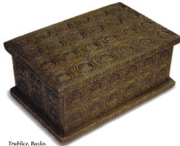
Trublice. Rusko. Ларец, Россия. Small chest. Russia.