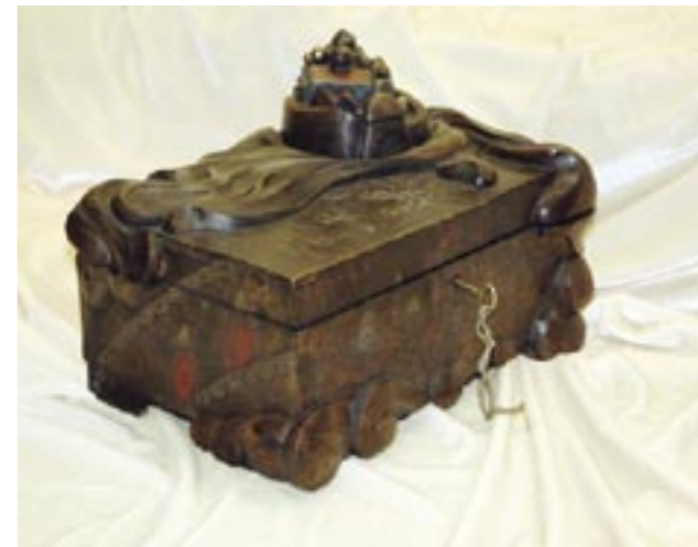
Krabíčka «Ostrov Bujan». Rusko, Talaškino. Projekt N. Rericha. Шкатулка «Остров Буян». Россия, Талашкино, проект Н. Рериха. “Buyan Island” casket. Russia, Talashkino. Design by N. Rerikh.

В 1904 году для продажи своих изделий М. К. Тенишева открыла в центре Москвы магазин «Родник». Продававшаяся в нем мебель пользовалась огромной