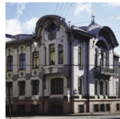
Mansion of Mindovskiy, 1903, arch. L. N. Kekushev

of Ostrogradsky. Majolica tiles were strengthened on front elevation with additional composition of chips and relief.