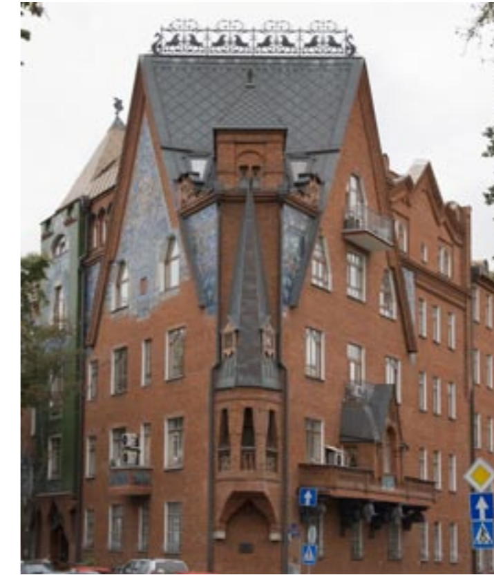
Obytný dům Percové, rok 1906—1911, inž. N. K. Žukov, výt. S. V. Maljutin Жилой дом Перцовой, 1906—1911 г., инж. Н. К. Жуков, худ. С. В. Малютин Living house of Pertsova, 1906—1911, engineer N. K. Zhukov, artist S. V. Maljutin

Interesting group is presented by mansions-museums, intended not only for dwelling, but also for allocation of artistic collections. House of P.I. Schukin is an example. Its front elevation, layout structure and interior finishing