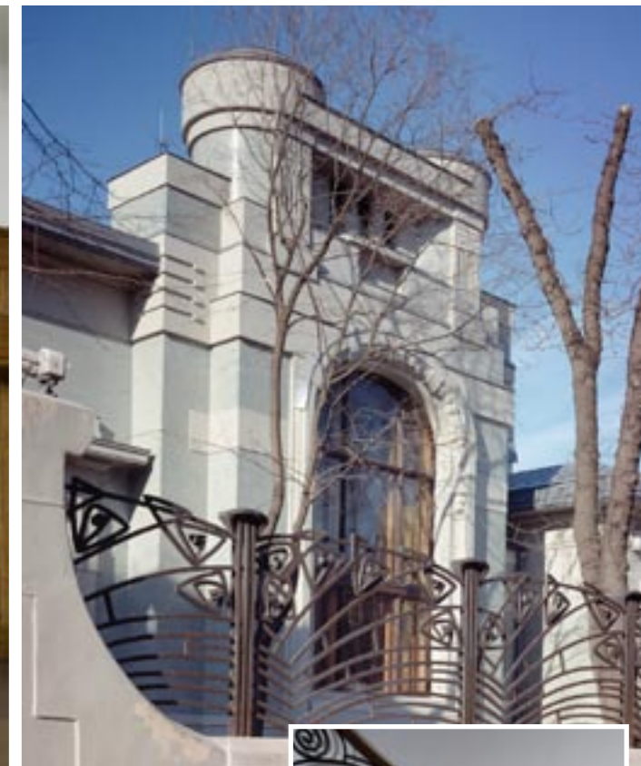
Vila Derožinské ve Štátné uličce, rok 1901. Krb, schody, arch. F. O. Šechtl.

Некоторые памятники еще ждут восстановления. Е.Г. Игнатьева подготовила проект реставрации Дома Гутхеля, построенного в 1902 г. архитектором В. Ф. Валькотом.