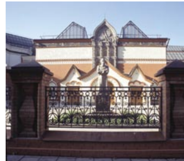
Budova Treťjakovské galerie, rok 1906, výt. V. M. Vasněcov Здание Третьяковской галереи, 1906 г., худ. В. М. Васнецов Building of Tretyakovskaya gallery, 1906, artist V. M. Vasnetsov

vyplněný mozaikou. Budova se tak stala jedním z nejnápadnějších příkladů využití skeletové struktury — principu, který se těšil velké oblibě v architektuře 20. století.