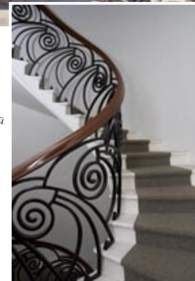
Mansion of Derozhinskaya in Sbatny Lane, 1901. Fireplace, staircase, arch. F. O. Shekbtel