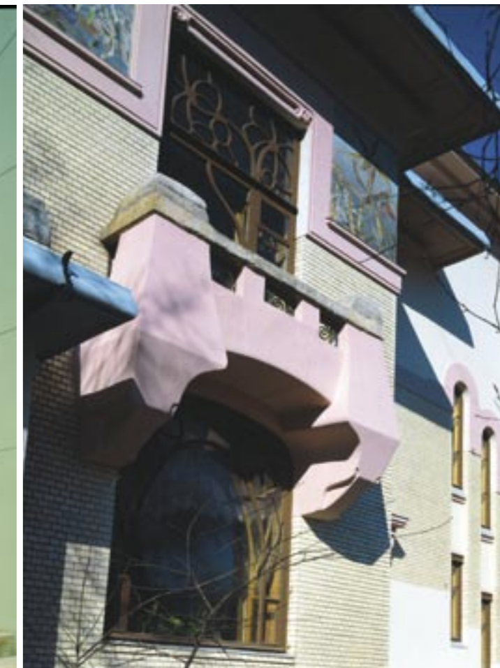
Vila Mindovského, rok 1903, arch. L. N. Kekushev