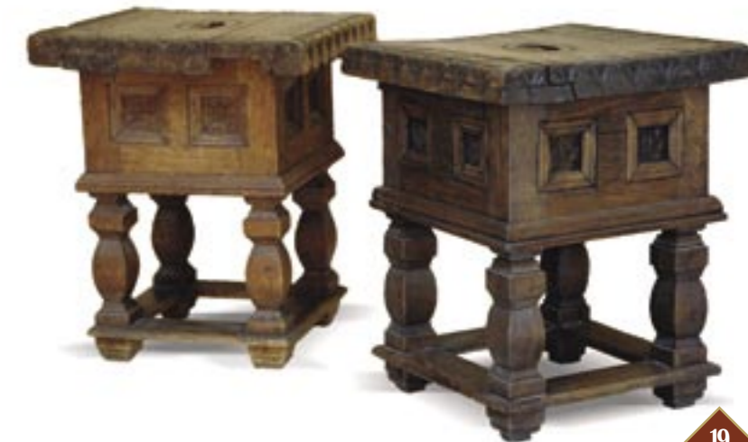
Stolička (2ks). Rusko, Abramcevo, kolem roku 1880. Projekt E. D. Polenové. Табурет (2шт.). Россия, Абрамцево, 1880 годы. Проект Е. Д. Поленовой. Stool (2 pieces). Russia, Abramtsevo, 1880s. Design by E. D. Polenova.