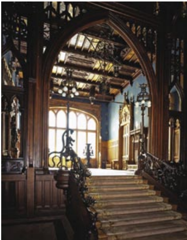
Vila Morozova, konec XIX. st., arch. F. O. Šechtěl Особняк Морозова, конец XIX в., арх. Ф. О. Шехтель Mansion of Morozov, end of XIX century, arch. F. O. Shekhtel