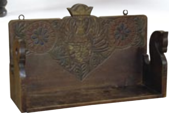
Polička «Sirin». Rusko, Sergijev-Pasat, kolem roku 1900. Projekt E. Teljakovského. Полочка «Сирин». Россия, Сергиев-Посад, 1900 годы. Проект Е. Теляковского. “Sirin” tringle. Russia, Sergiyev-Posad, 1900s. Designed by E. Telyakovsky.