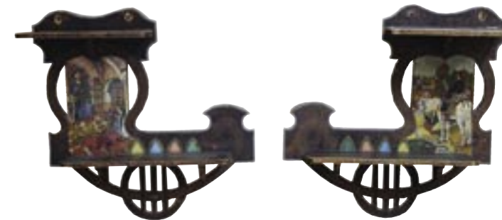
Poličky (2ks). Rusko, Vjatské dílny národního umění, kolem roku 1900. Полочки (2шт.). Россия, Вятские кустарные мастерские. 1900 годы. Tringles (2 pieces). Russia, Vyatka handicraft studio, 1900s.

1900-е годы были в России периодом широчайшего увлечения русским стилем, наиболее зримо проявившимся в характере жилой среды. Несомненное первенство в этом художественном процессе поисков национального своеобразия принадлежало Москве.