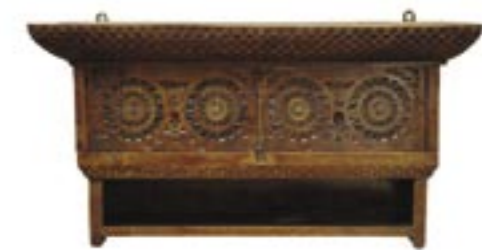
Police. Rusko, Abramcevo, kolem roku 1880. Projekt E. D. Polenov. Полка. Россия, Абрамцево, 1880 годы. Проект Е. Д. Поленовой. Shelf. Russia, Abramtsevo, 1880s. Design by E. D. Polenova.