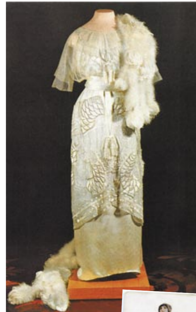
Večerní róba, rok 1910–1911, Moskva, ateliér N. P. Lamanové Платье вечернее. 1910–1911 гг., Москва, Мастерская Н. П. Ламановой Evening dress. 1910–1911, Moscow, Studio of N. P. Lamanova

Рубеж XIX–XX веков в России, получивший название «Серебряного века», отмечен высочайшими достижениями русской культуры во всех областях. Мода занимала в этом процессе важное место. Создание новой концепции костюма, поворот к рациональности и функциональности, новые принципы декора формировались в Европе при непосредственном и активном участии русских художников. Именно в модерне можно увидеть зарождение грядущих стилей ар-деко и русского авангарда.