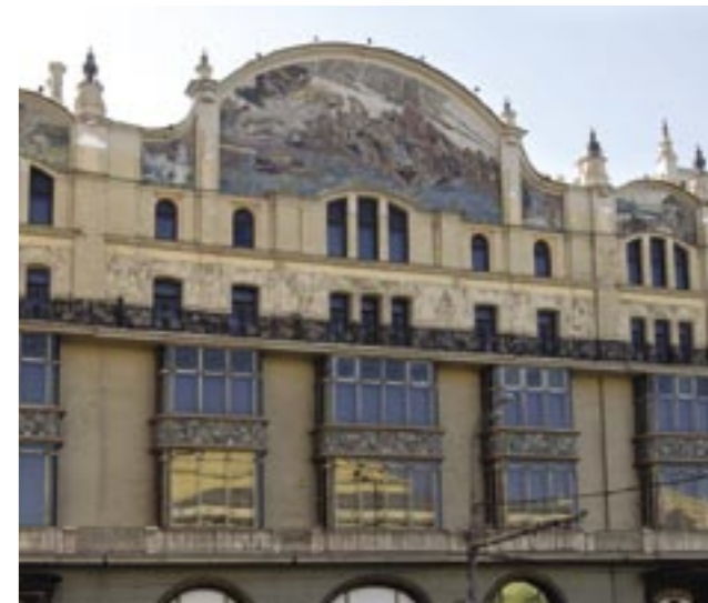
Budova hotelu Metropol, rok 1899–1903, arch. V. F. Valkott, výtvarník M. A. Vrubel Здание гостиницы Метрополь, 1899–1903 гг., арх. В. Ф. Валькотт, худ. М. А. Врубель Building of Metropol hotel, 1899–1903, arch. V. F. Valkott, art. M. A. Vrubel