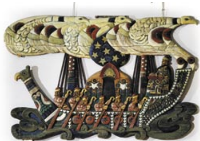
Dekoratívni talíř «Sadko — bobatý host». Vyrobeno po obrázku S. V. Maljutina pro interiér moskevského obchodu «Rodnik». Ruský kupec s bylinkami Sadko v loďce s vesly symbolizoval úspěšné podnikání.