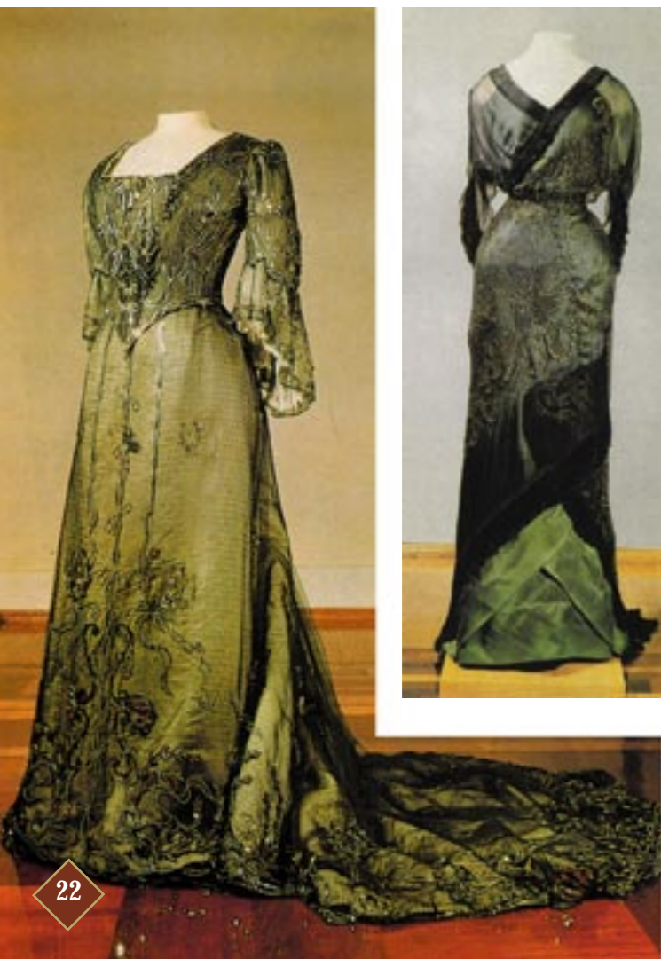
Večerní róba, rok 1913–1915, Moskva, ateliér N. P. Lamanové Платье вечернее. 1913–1915 гг., Москва, Мастерская Н. П. Ламановой Evening dress. 1913–1915, Moscow, Studio of N. P. Lamanova

В России театральный костюм и мода в период модерна становятся неразрывными понятиями. Театральный костюм Русских сезонов в Париже оказал сильное влияние на европейскую моду. Особый успех выпал на долю выдающегося художника Леона Бакста. Успех оформленных им двенадцати спектаклей дягилевской антрепризы побудил владельцев парижских модных домов обратиться к нему с заказами на эскизы костюмов. Тогда же судьба свела его с Полем Пуаре. Апофеозом их совместного творчества стали наряды, вдохновленные балетами на восточные и античные темы. Свободные платья без корсетов, прозрачные ткани, большие декольте и открытые руки, тюрбаны с перьями и юбки-шальвары широко проникли в светские салоны. С именем Бакста связан и первый театрализованный показ мод. Это было организованное Пуаре модное дефиле, перешедшее в маскарад, где демонстрировались костюмы, созданные по мотивам балета «Шехерезада».