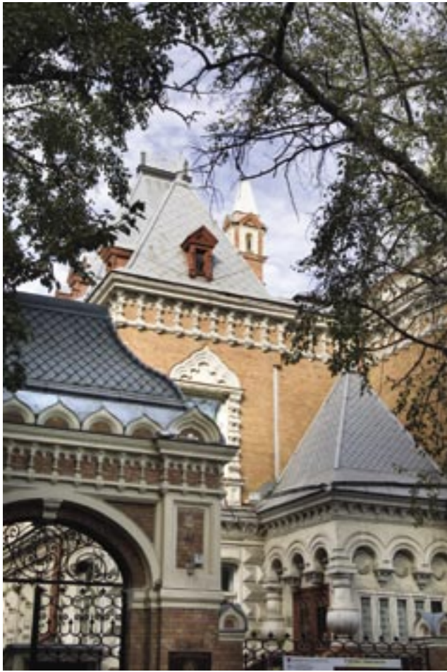
Dvorcový komplex P. I. Ščukina, konec XIX. — začátek XX. st. Усадебный комплекс П. И. Щукина, кон. XIX — нач. XX вв. Estate complex of P. I. Schukin, the end of XIX century — the beginning of XX century.

In the end of nineteenth century Russian architecture went through tremendous upsurge, caused by successes of economic and industrial development and accompanied by search of new artistic methods and by development of new style, called “modern” in Russia.