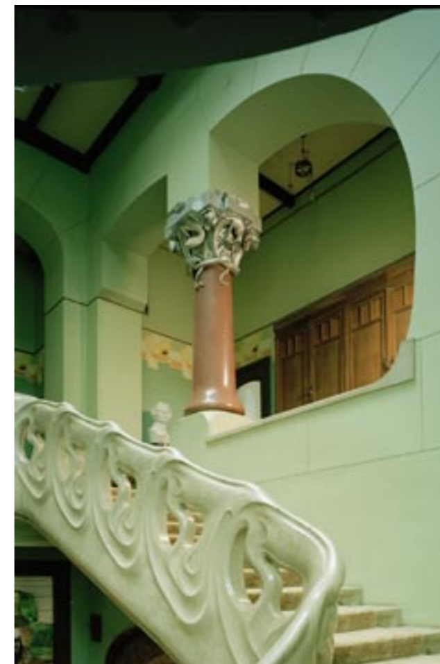
Vila Rjabušinského. Fragment fasády, schody, arch. F. O. Šechťel. Особняк Рябушинского. Фрагмент фасада, лестница, арх. Ф. О. Шехтель Mansion of Ryabushinsky. Fragment of the façade, staircase, arch. F. O. Shekhtel

Vast works are performed on front elevation restoration of Moscow monuments of modern epoch usign conventional reconstruction of decorative details. Interesting and indicative example is works on restoration of front elevations of doctor F. A. Alexandrov's house. In Merzlyakovskiy Lane, 20. This three storey house was built by architect A.A. Ostrogradsky design in 1902. Before restoration front elevations lost forged tracery balconies, gate grating and window joiner's fillings. Restoration project by direction of E.I. Tolstopyatenko foreseen not obly reconstruction of lost forms but construction of fourth storey. This unrealized project was developed in 1912 by K. S. Razumov, assistant