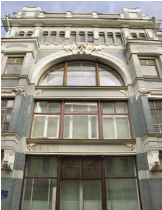
Obchodní dům Aršinova, rok 1899, arch. F. O. Šebchtěl Торговый дом Аршинова, 1899 г., арх. Ф. О. Шехтель Trade house of Arshinov, 1900, arch. F. O. Shekhtel