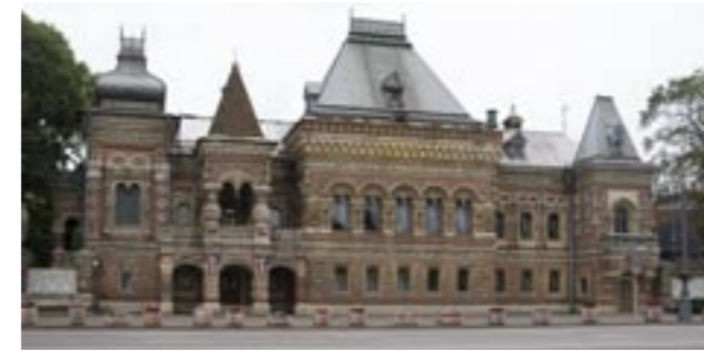
Městský dvorec, XIX. — začátek XX. st., arch. N. I. Pozdějev Городская усадьба, XIX — начало XX в. арх. Н. И. Поздеев City estate, XIX — the beginning of XX century, arch. N. I. Pozdeyev

Methods of modern in combination with new technical possibilities allowed to create buildings with new functional features. Erecting Torgovy Dom of V.F. Arshinof in Staropansky Lane in 1899, F.O. Shekhtel enlarged all elements, transformed shopwindows in glass paintings,