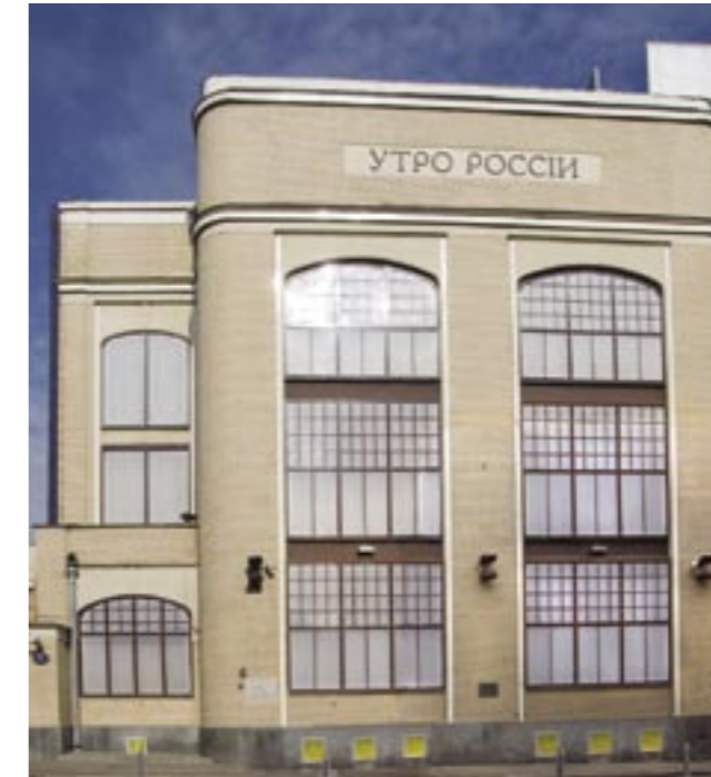
Budova typografie Ruské ráno, rok 1907, arch. F. O. Šebchtěl Здание типографии Утро России, 1907 г., арх. Ф. О. Шехтель Building of Utro Rossii printing-house, 1907, arch. F. O. Shekhtel

Собственный стиль в духе английского модерна представляют постройки В. Валькота — особняки Якуничевой и К. Гутхейла в Пречистенском переулке. Их отличает сдержанность и простота форм с четким вертикальным членением, обилием остекленных поверхностей, красотой отдельной детали. Крупнейшая работа Валькота — гостиница «Метрополь», спроектированная в 1899 г., интересна решением крупного объема со световыми перекрытиями внутреннего пространства, известна майоликовыми панно на фасадах по эскизам М. Врубеля и уникальными витражами в интерьерах.