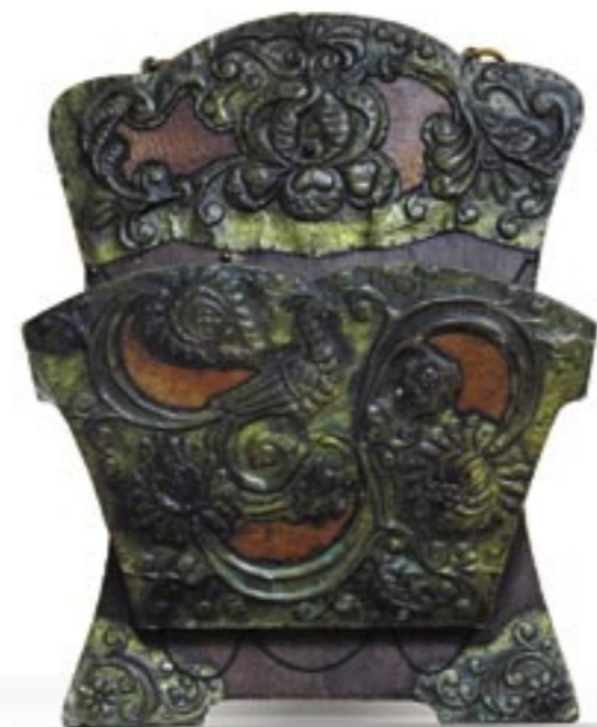
Držák novin. Rusko, Sergijev-Posat, kolem roku 1910. Газетница. Россия, Сергей-Посад, 1910 годы. Magazine rack. Russia, Sergiyev-Posad, 1910s.